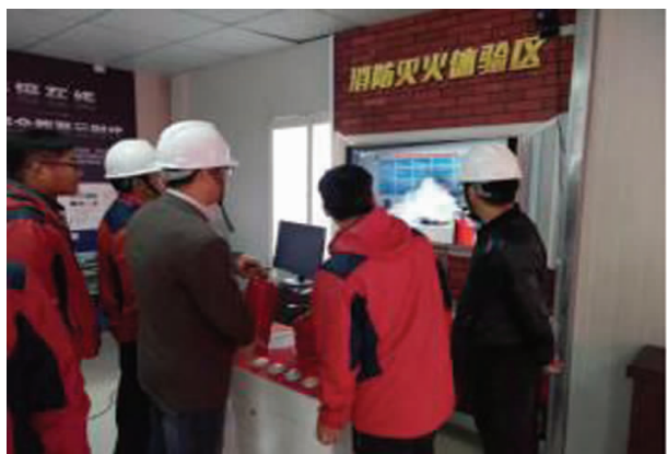
图9 消防灭火体验区