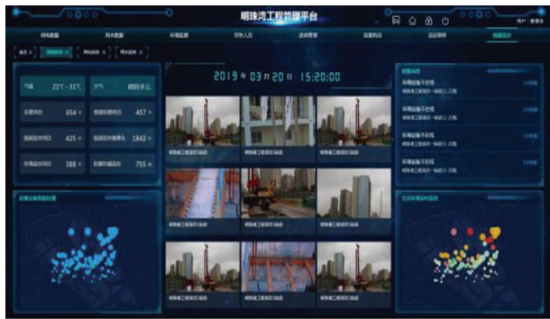
图 15 视频监控管理

智慧工地平台,可以实时查看设备运行情况,预警情况等。对重点施工机械做定位管理,实时掌握设备的具体位置,记录设备运行的轨迹数据,使设备安全、高效地运行。