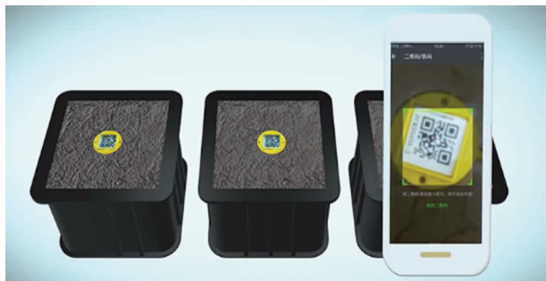
图 13 见证取样管理

申请取样信息, APP 同时对取样位置进行 GPS 定位。见证人扫描二维码, 核对检测申请信息, 确认见证信息。检测单位只需扫描二维码即可获得检测委托信息, 实现检测过程中盲检管理, 通过同广州市检测监管平台获取检测报告数据, 实时了解青少年宫材料质量情况。管理人员可通过系统对见证员与取样员的见证取样信息进行监督, 若见证员递交见证信息的时间与取样员递交取样信息的时间间隔不合常理, 见证员、取样员及工程 GPS 地理位置坐标相比较有问题, 则可判定双方是否真正同时完成了见证取样工作, 监督更有效。如图 13 所示。