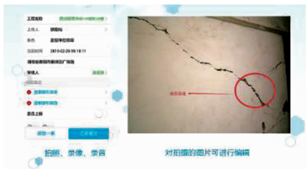
图 12 拍照取证

申请取样信息, APP 同时对取样位置进行 GPS 定位。见证人扫描二维码, 核对检测申请信息, 确认见证信息。检测单位只需扫描二维码即可获得检测委托信息, 实现检测过程中盲检管理, 通过同广州市检测监管平台获取检测报告数据, 实时了解青少年宫材料质量情况。管理人员可通过系统对见证员与取样员的见证取样信息进行监督, 若见证员递交见证信息的时间与取样员递交取样信息的时间间隔不合常理, 见证员、取样员及工程 GPS 地理位置坐标相比较有问题, 则可判定双方是否真正同时完成了见证取样工作, 监督更有效。如图 13 所示。