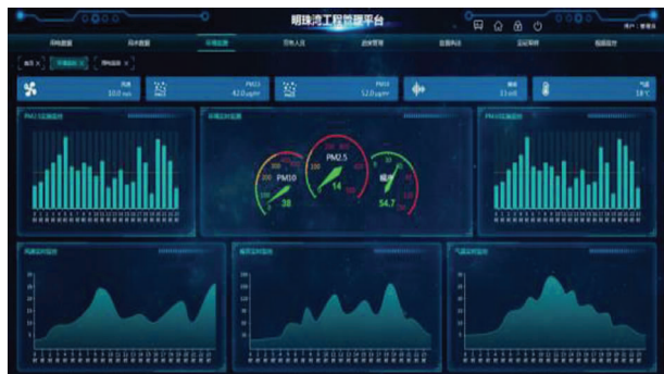
图 14 系统环境监测

(1) 施工前, 在建立的 BIM 模型上分析、计算, 选择最合适的位置布置扬尘、噪音、气候监测仪器。现场施工过程中监测设备将采集的信息上传至系统, 系统后台已经根据绿色施工标准设定了这些项目的预警值, 当分析之后若达到预警值之后将会联动防尘控制设备等, 作出处理。