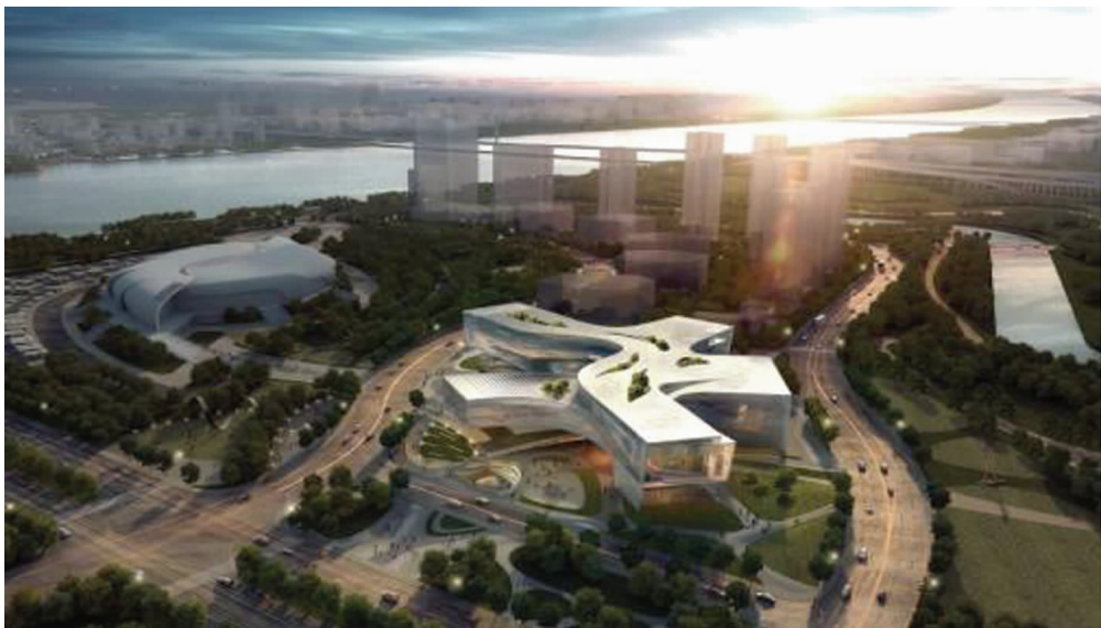
图1 南沙青少年宫项目效果图

南沙青少年宫项目主要建设内容包括剧场、素质教育区、对外交流区、特色科技中心、办公区、服务区、辅助用房、地下室及其他辅助配套设施、户外活动场地等,致力于把南沙青少年宫建设成一个集社会体验、科技、体育、团队活动及艺术教育等功能于一体的具有粤港澳青年特色的现代化综合性国际青少年交流活动基地。除基础设施外,还对信息化建设提出了较高的要求,工期紧张。根据上级指示要求,建设要紧扣十八大关于“创新、协调、绿色、开放、共享”的五大发展理念,充分体现明珠湾区“绿色生态、低碳节能、智慧城市、岭南特色”规划建设理念,建成满足南沙未来十年发展需要的“国际化、高端化、精细化、品质化”青少年交流活动基地。这些建设理念要求项目经理在项目实施初期就制定出高品质建设方案,并要积极推动智慧工地系统落地,且项目以争创鲁班奖为目标,对质量和管理