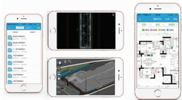
图11 施工现场安全质量巡检 APP

为了更便于质量管理,青少年宫项目以智慧工地系统为依据,开发了施工现场安全质量巡检 APP (见图 11),使用手机端就可完成施工现场检查记录填报,各方人员都可查看,所有的信息被集中起来,而且也便于事后检查。