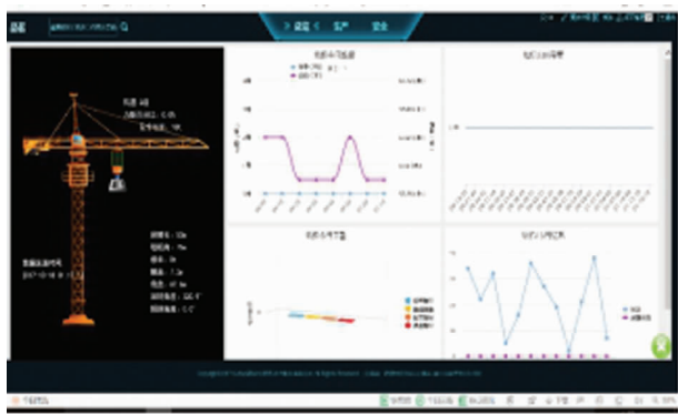
图 16 塔吊监控

在设备管控方面,通过设备预警情况的分析,可以通知类似项目在施工过程中遇到相同施工情况时,提前预防该类型事故发送的风险。如基坑建设施工中,出现同类型地质情况时可以做提前预防,加固等处理。通过塔吊运行情况分析,对安装情况,高度、重量做相应的规定,如图 16 所示。