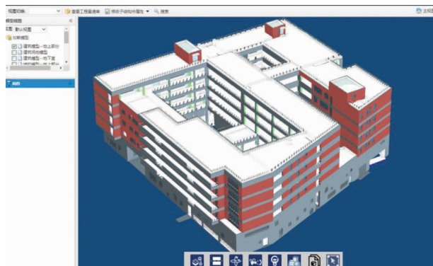
图 2 在线浏览

平台通过算法将原来 BIM 模型的体积进行压缩和瘦身,保证用户可以在网页端流畅地浏览模型并进行操作互动。用户在平台上既可以查看模型构件信息,也能使用剖切框查看建筑物内部情况,便于项目各参与方对交付成果的快速查看和审核。